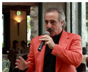
この時期だけ聴くことができる曲が