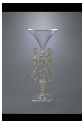
「ドラゴン・ステム大杯」 19世紀