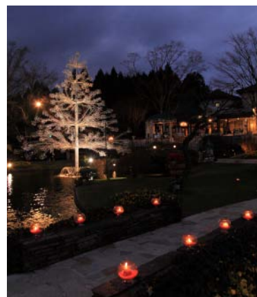
ランタンとキャンドルホルダーが庭園一面に