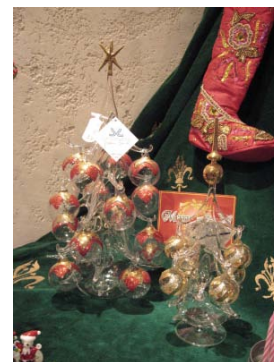
イタリア SOFFIERIA PARISE 社製 ¥9,240～(税込)