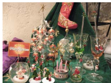
とっておきの一品を

世界各国から直輸入した5千種10万点の品揃えを誇るショップでは、今年もヨーロッパの最新クリスマスアイテムをご用意しました。