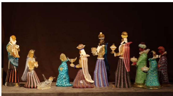
キリスト誕生シリーズ「プレセピオ」 20世紀