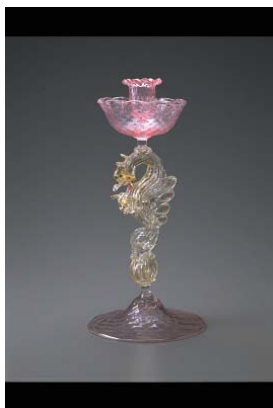
「龍装飾脚キャンドルスタンド」 19世紀