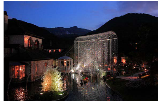
夜の美術館でロマンチックなひとときを

〈お問い合わせ〉 箱根ガラスの森美術館 広報担当 田畑・津軽・川井・坂元 〒250-0631 神奈川県足柄下郡箱根町仙石原 940-48 E-mail: museo@ciao3.com TEL 0460-86-3111 FAX 0460-86-3116