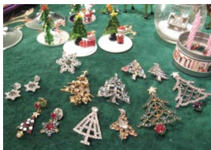
ドイツ ANTON HUBNER 工房 ¥2,940～(税込)