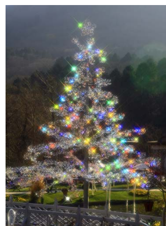
太陽と風で七色に輝くアベータ