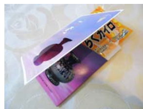
ポカポカチケット中身