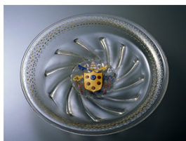
「メディチ家紋章文コンボート」16世紀初