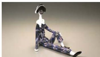
「アルレッキーノ」1950年