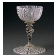
「レース・グラス・ワイングラス」18世紀