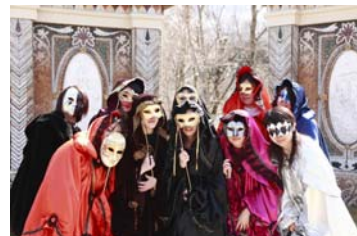
ヴェネチア仮面祭の様子

ヴェネチア製の仮面やマントを、ご来館のお客様に無料で貸出しをいたします。ヴェネチアの仮面祭は世界3大カーニバルの1つに数えられ、世界各国からの観光客が思い思いの衣装に身を包み、ヴェネチアの街を闊歩します。様々なデザインの仮面や、好きな色のマントを身に着けて、いつもとは違う雰囲気でお楽しみください。