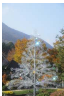
クリスタルラブツリー

(*) http://ranking.goo.ne.jp/column/article/goorank/38015/