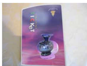
ポカポカチケット表紙

寒い季節に心も身体も暖かくなって作品を鑑賞していただきたいとの思いから、冬季限定で入館チケットをカイロ付きのチケットにいたしております。チケットにはヴェネチアン・グラスの作品を載せてお洒落に仕上げています。次回の来館時に再びお持ち頂くと、1名様に限り300円のリピーター割引の機能も付いています。