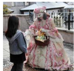
昨年の配布の様子