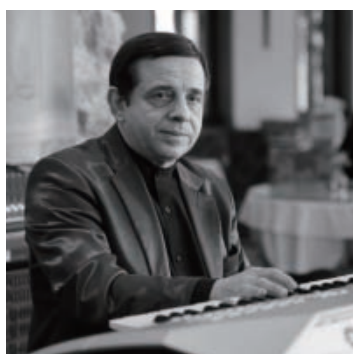
ディ・アマリオ・エンツォ DI AMARIO VINCENZO

館内レストラン“カフェテラツァ”にて毎日好評を頂いている、本場イタリア人歌手によるカンツォーネ コンサート。日頃のお客様への感謝の気持ちを込め、開館記念感謝デーの8月8日・9日・10日は、特別ライブ「カンツォーネ フェスタ vol.3」を庭園内特設ステージにて開催いたします。3回目となる今年は、古典ナポレターナからサンレモ音楽祭の名曲をはじめ、60年代イタリアンポップス、21世紀の最新ヒット曲まで幅ひろくカンツォーネの名曲をお届けいたします。箱根の山々に囲まれた豊かな自然の中、3日限りのスペシャル・プログラムをお楽しみください。