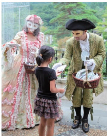
プレゼント配布の様子