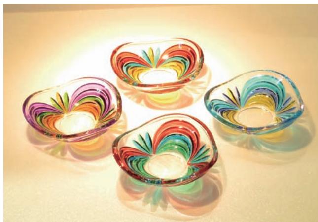
ZECCHIN 社製クリスタルガラス小皿 いずれか1点をプレゼント